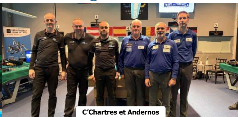
C'Chartres et Andernos