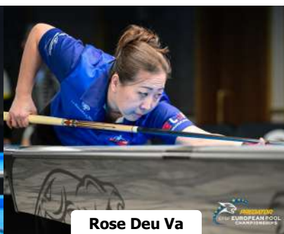
Rose Deu Va